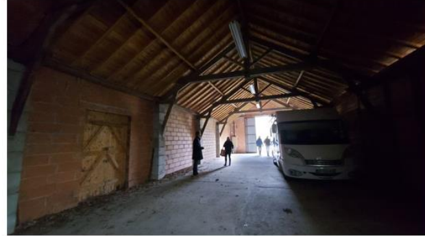
Vue depuis le fond près du point d'eau