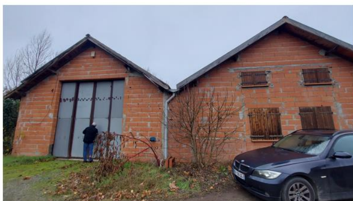
Entrée de ce qui pourrait être notre local