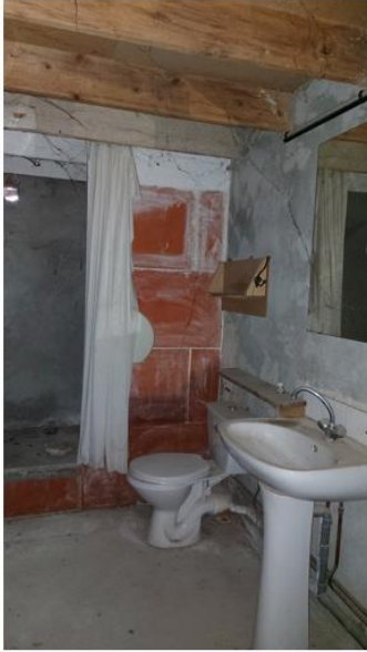
Le point d'eau au fond douche Wc lavabo