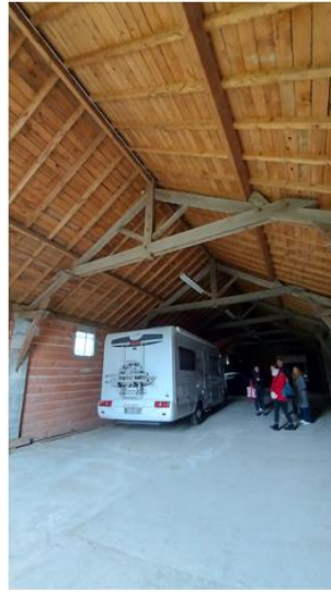
Vue depuis la porte d'entrée